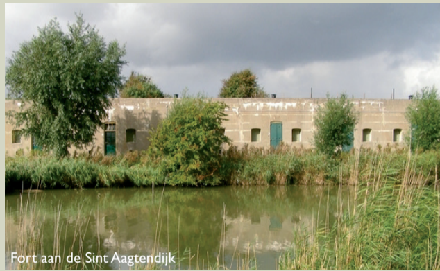
Fort aan de Sint Aagtendijk

Uniek aan dit fort is de in beton uitgevoerde zogenaamde frontcaponnière: een middenvoor aan de fortwal gelegen uitbouw, aan weerszijden voorzien van schietgaten voor het geven van zijwaarts gericht vuur. Het fort is nu in gebruik door Stichting Fortpop en heeft de bijzondere bestemming gekregen als oefenruimte voor muzikanten. www.stellingvanamsterdam.nl