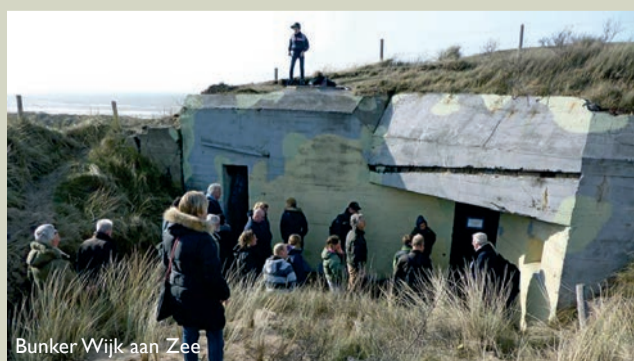
Bunker Wijk aan Zee

U bevindt zich nu in het dorp Wijk aan Zee. Wijk aan Zee werd als onderdeel van de Festung IJmuiden in 1943 hermetisch afgesloten. De bevolking moest evacueren en militairen namen hun intrek in de huizen en hotels. De Duitse bezetter werkte in het kustgebied aan de bouw van een uitgebreid stelsel van kustbatterijen, luchtafweerbatterijen, commandocentra en infanterieinstellingen.