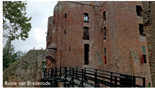
Ruïne van Brederode