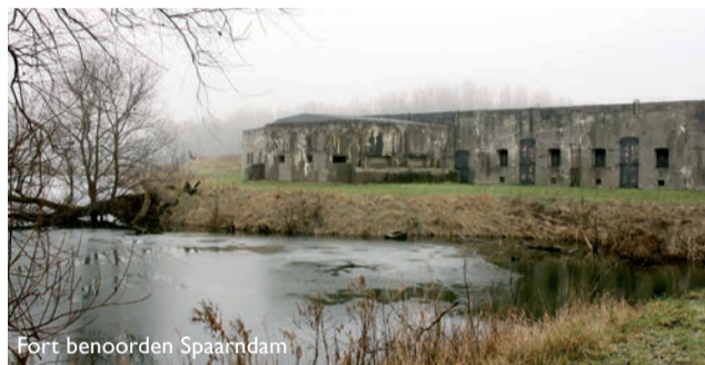
Fort benoorden Spaarndam

Het Fort benoorden Spaarndam maakte deel uit van de Positie bij Spaarndam, dat onderdeel uitmaakt van de Stelling van Amsterdam . Het fort werd gebouwd tussen 1895 en 1901 en had tot taak de smalle inundatiestrook tot aan de duinen en de strategische positie van de waterwerken in Spaarndam (sluizen, gemaal) te verdedigen. www.stellingvanamsterdam.nl